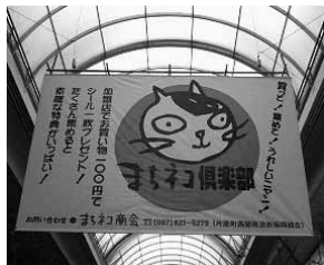
アーケードにはどどんと まちネコ倶楽部の垂れ幕が!

商店街の復興計画という、隣り合う商店街同士意見がまとまらない、各店主の参画意識が薄く、足並みが揃わない云々という話をよく聞きます。また、組合で決められた“●●運動”や“▲▲サービス”等は、せいぜい役員をしている店舗のショーウィンドーにポスターが貼られておしまい…という結果を招きます。そんな中で、隣近所の商店街が共同で展開している「まちネコ倶楽部」の活気は、ミラクルと言えます。