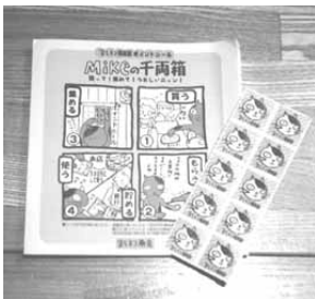
これがミケの千両箱だ!

確かに、企画する側から見ると時代遅れなチープなしくみ、と思われがちです。しかし、ちまちまシールを集めて、台紙(ミケの千両箱というしゃれたネーミングがにくい)に貼るという作業は、なかなか集める側にとっては、“貯めている感”が沸いてきて、結構気分が盛り上がるものです。