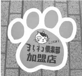
これがぺたぺた貼られている